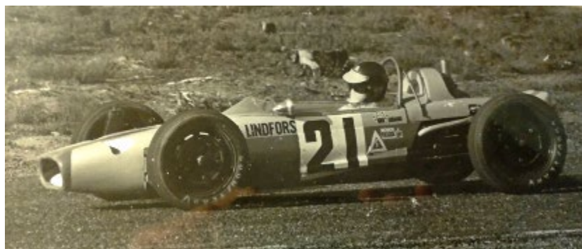
Lage, Midnattsloppet 1969