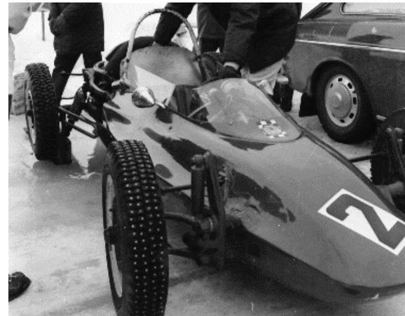
Peos Beach car 1966