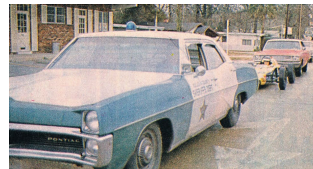
Poliseskort från verkstad till banan i USA