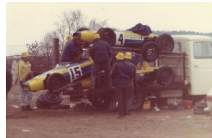
Team RPB:s Opel Blitz med plats för 3st formelbilar, av konkurrenterna kallad för "Tattarlasset".