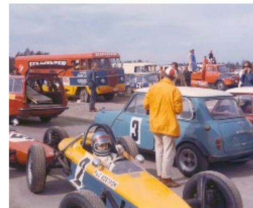
Peo, Dalsland Ring 1970