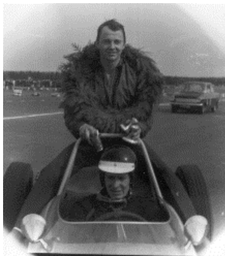
Peo på Brors bil efter seger i Midnattsloppet