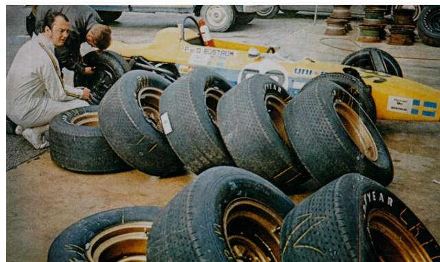
Daytona 1970, avsågad nos