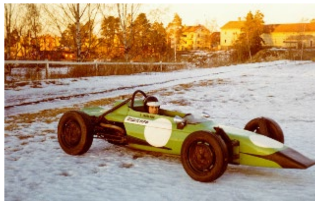
Bror i sin RPB -70 utanför Racing Plast

Även detta år så kvalade teamet i form av Peo in till VM på Daytona, när grabbarna kom dit så visade det sig att reglementet såg annorlunda ut och att deras bil var för lång, vilket resulterade i att de fick såga av nosen på den alldeles nytillverkade formel vee bilen.