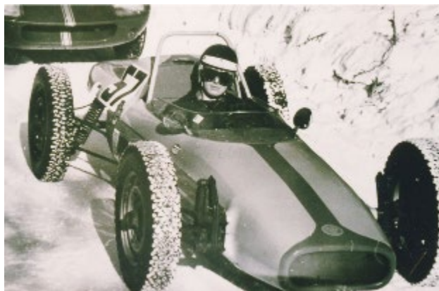
Bror i sin RPB 1967

Peo stod efter säsongens slut stod som totalsegrare i Formel Vee mästerskapet, vilket gav bra publicitet och vind i seglen.