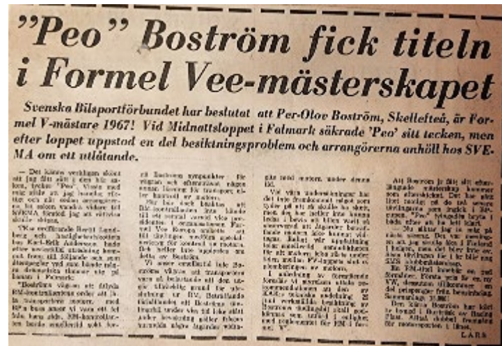
Peo säkrar Formel Vee titeln 1967