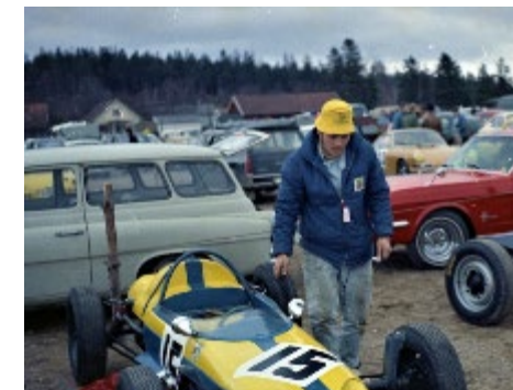
Lage, Falkenberg 1969