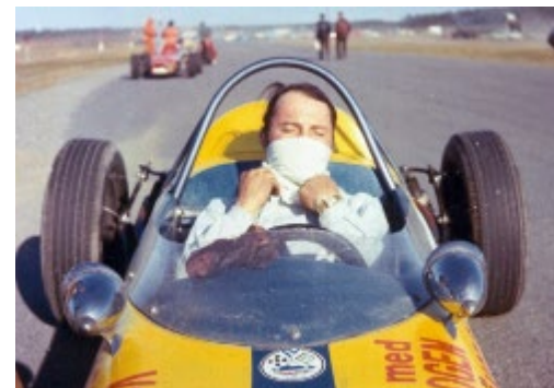
Peo, Falkenberg 1969