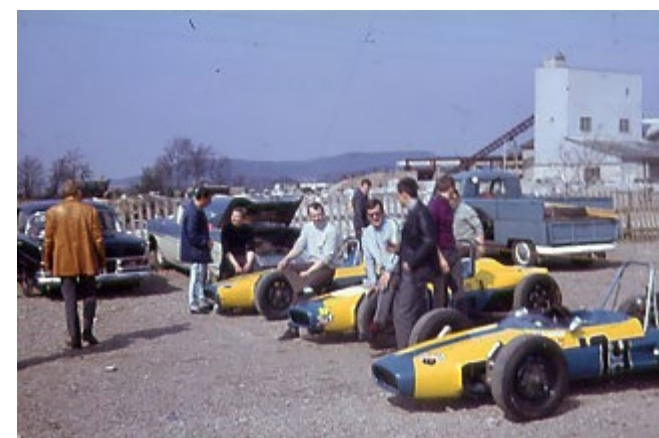
Team RPB, Falkenberg 1968